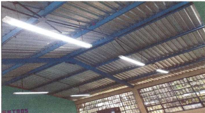
Foto 3: Reparación de sistema eléctrico: sustitución de lámparas de 2X40; sustitución de interruptores, reparación de cableado eléctrico y sustitución de ducto eléctrico + accesorios.