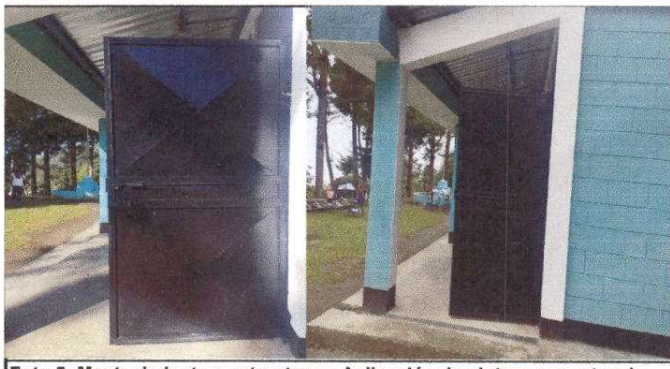
Foto 5: Mantenimiento a estructuras: Aplicación de pintura a puertas de metal.