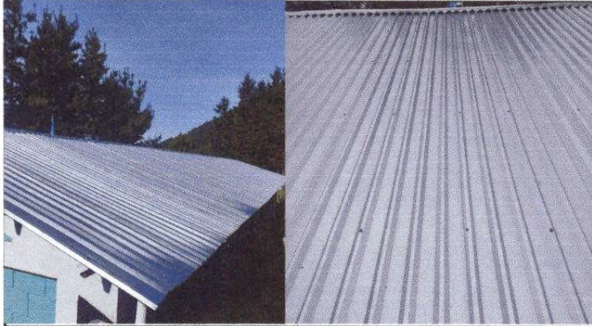
Foto 1: Sustitución de lámina por lámina troquelada Aluzinc, calibre 26.