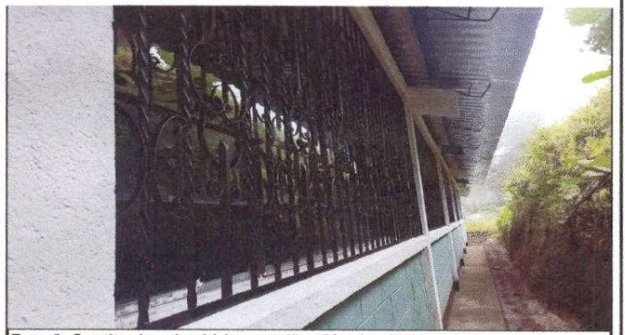
Foto 6: Sustitución de vidrios y aplicación de pintura a balcones de metal.

Observación: Si es necesario se pueden agregar hojas adicionales y actualizar el número de hojas.